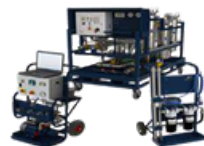
DIALIZADO Y SECADO