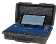
PARTICLE PAL LIFE